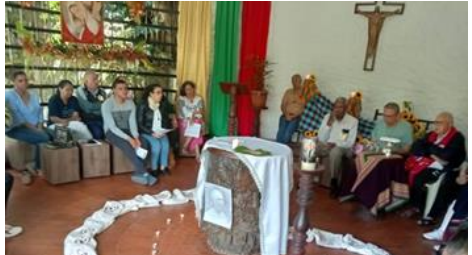
Eucharistie, 1er décembre, avec la Fraternité séculière et la Famille spirituelle de Colombie, Medellín 2023.

Nous sommes allés au séminaire conciliaire de l'archidiocèse de Medellín, où, en 1968, s'est réunie la deuxième conférence générale des évêques d'Amérique latine, ce qui fut un moment décisif et transcendantal de la réflexion théologique de ce continent.