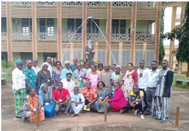
Grand séminaire Saint Gall de OUIDAH au Bénin

Les participants au nombre de trente (30) étaient composés de deux prêtres, d'une sœur religieuse et de vingt-sept laïcs, venant des sept pays suivants : le Benin, le Burkina Faso, le Congo, Madagascar, le Niger, la Tanzanie et le Maroc, pays invité.