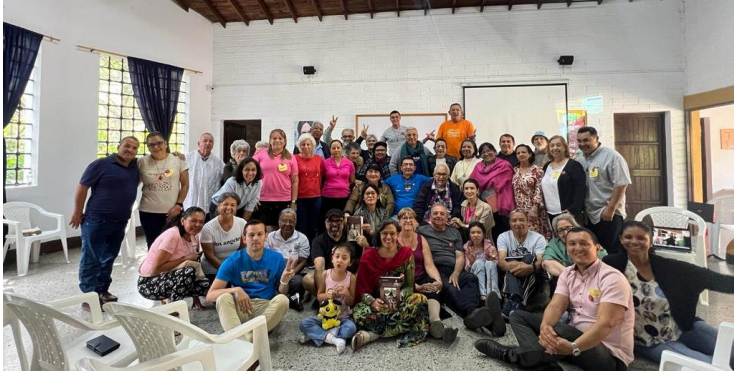
Le père Federico a partagé quelques réflexions de l'encyclique Fratelli Tutti.

tournesols, déposés dans toute la chapelle, sont passés dans les mains de ceux qui étaient là, pour marquer ce temps fort de souvenir. Et nous avons vécu la veillée préparatoire au 1er décembre en illuminant la nuit avec des feux d'artifice qui sont une tradition dans la ville, à la veille du mois de décembre, mois qui ici signifie la fête.