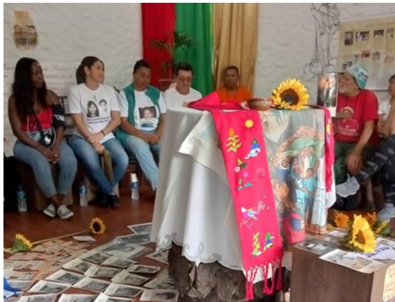
Mémoire de nos martyrs, Medellín 2023.