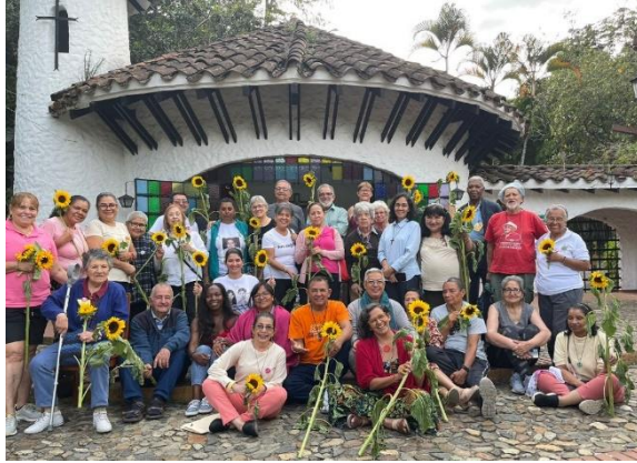
Rencontre continentale, Fraternité séculière et famille spirituelle Saint Charles de Foucauld. Medellín 2023, Colombie.