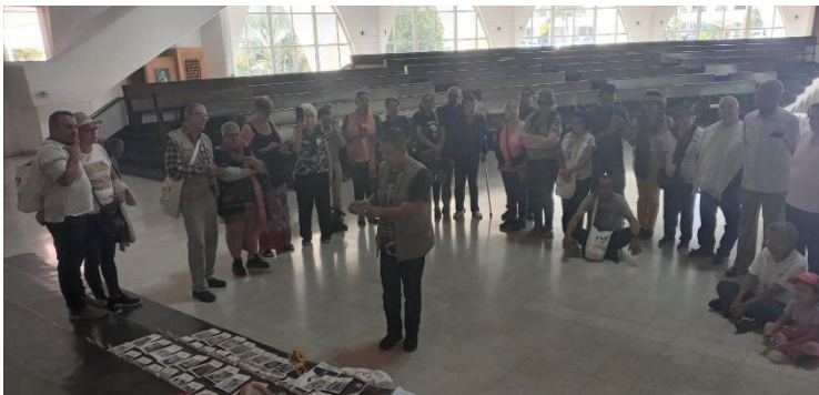
Prière dans le temple principal du séminaire conciliaire de Medellín 2023.

Nous sommes allés au séminaire conciliaire de l'archidiocèse de Medellín, où, en 1968, s'est réunie la deuxième conférence générale des évêques d'Amérique latine, ce qui fut un moment décisif et transcendantal de la réflexion théologique de ce continent.