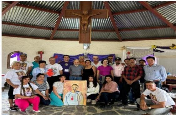
Fraternité Charles de Foucauld du Nicaragua. Esteli, Nicaragua, 2024.

Cette merveilleuse rencontre a eu lieu pendant la Semaine Sainte, du 25 au 29 mars, où nous avons eu la présence de 40 membres de la fraternité, tant à La Garnacha que dans leurs communautés, qui nous ont accueillis avec affection, simplicité et gentillesse, créant une atmosphère de Nazareth entre nous tous. Leur écoute, leur docilité et leur partage ont rendu possible l'objectif de la formation centrée sur l'unique modèle : Jésus de Nazareth et sur les éléments fondamentaux des rencontres qui permettent aux frères et sœurs de vivre la spiritualité de Nazareth.