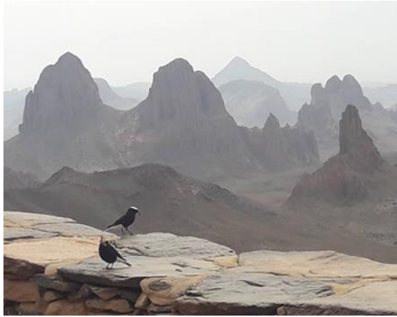
Montagnes de l'Assekrem, Tamanrasset, Algérie.

temps d'admirer, comme le soleil au petit matin à l'Assekrem, les premières gouttelettes de pluie qui viennent réveiller les herbes jaunies par le soleil après un long temps de sécheresse ; merci à frère Charles de me rappeler que Dieu est toujours avec nous et combien Il est bon, combien Il nous aime... malgré nos cruautés et imperfections.