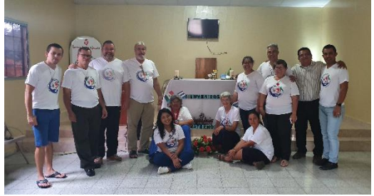
Réunion de la région Amérique centrale et Caraïbes. Honduras, 2020.