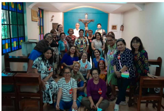
La Fraternité Séculière Charles de Foucauld aux Philippines.

L'espérance est présente en chacun de nous parce que toute notre vie est centrée en Jésus qui accompagne le chemin de notre fraternité et nous aide à traverser les hauts et les bas de notre vie quotidienne.