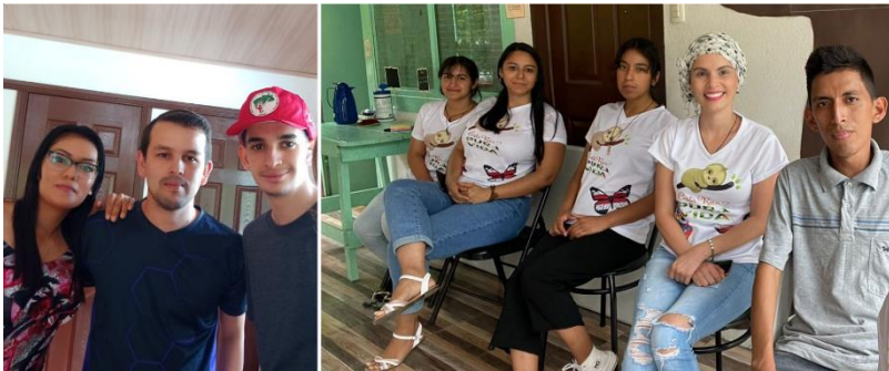
Jeunes de la Fraternité Séculière Charles de Foucauld en Amérique.

Nous les jeunes, nous sommes insérés dans la réalité de chaque pays, depuis les luttes sociales (apportant notre soutien aux personnes : amitié, nourriture et service) jusqu'aux luttes politiques (à la recherche de l'égalité et de la justice). En nous rencontrant virtuellement et physiquement, nous partageons ces réalités en nous nourrissant et en nous fortifiant des expériences des autres. Nous partageons autour de l'évangile, nous invitons chacun à partager son expérience et échangeons autour de la vie du frère Charles et des enseignements de Jésus.