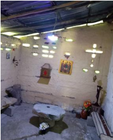
Chapelle, Maison des Petits Frères de l'Évangile. Bojo, Sanare, Venezuela 2024.

Avec le groupe de jeunes, en dehors des diverses activités quotidiennes d'étude et de travail, nous préparons, tous les deux mois, une célébration communautaire de la Parole ainsi que des rencontres spécifiques comme celles pour l'anniversaire de saint Charles de Foucauld, la Semaine Sainte et Noël. Nous nous retrouvons également pour fêter l'anniversaire de l'un des membres de notre fraternité et nous restons en contact permanent entre nous.