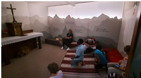
Réunion de l'équipe internationale à Orsay, France, juillet 2022.