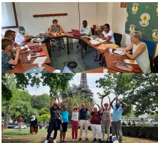
Réunion de L'équipe Internationale, Orsay, France, juillet 2022.