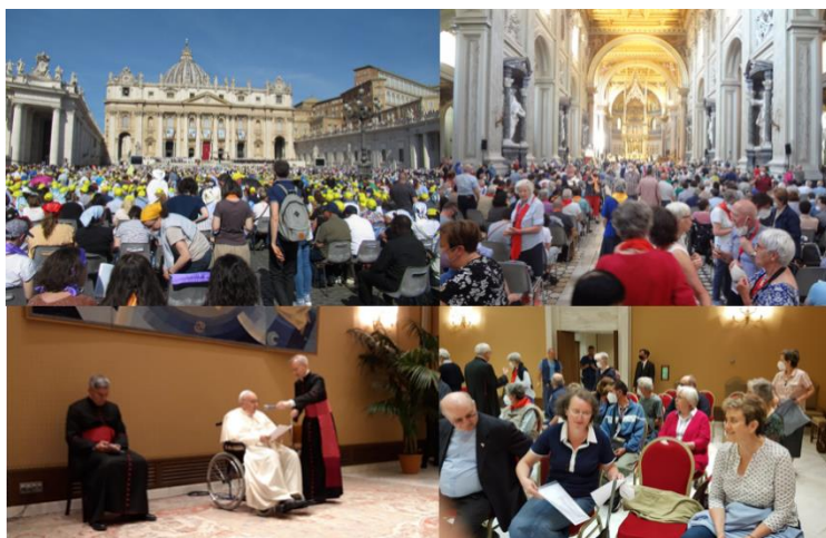
Rome, Italie. Mai 2022.