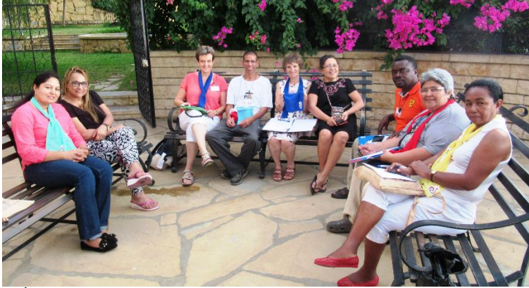
Équipe internationale 2018-2024. Beyrouth, Liban août 2018.

cheminé pendant ces 6 dernières années, dans le service qui nous a été confié, et cela a été une grande bénédiction.