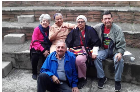
Réunion continentale Medellín, Colombie 2023.