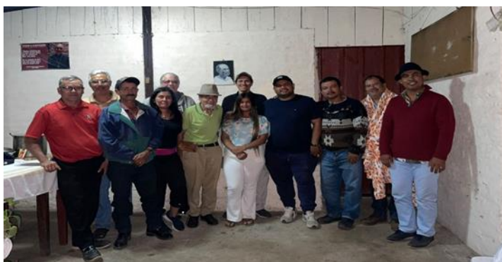
Membres de la Fraternité Charles de Foucauld au Nicaragua et au Honduras. Estelí, Nicaragua, 2024.

La vie de Nazareth doit être vécue de l'intérieur, de la maison et de notre fraternité ; c'est pourquoi être parmi les autres signifie aussi aller à la rencontre de nos frères et sœurs fraternels qui vivent la même spiritualité. C'est la raison pour laquelle nous avons accompagné la Fraternité du Nicaragua, afin de la dynamiser, de la former et d'harmoniser notre vie avec les Fraternités du Honduras.