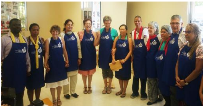
Assemblée Générale de la Fraternité Séculière Charles de Foucauld. Liban 2018.

Revêtus de ce tablier bleu, nous étions prêts à parcourir les 6 années de service, mission qui nous est confiée pour servir la grande famille de la Fraternité séculière Charles de Foucauld.