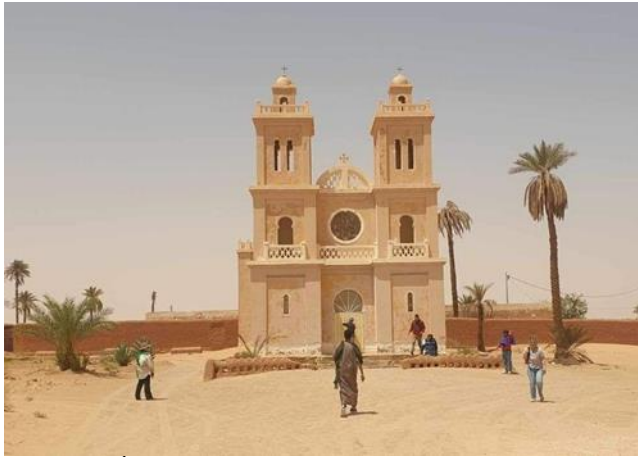
Église, El Golea. El Menia, Algérie.

« Je veux habituer tous les habitants chrétiens, musulmans, juifs et idolâtres à me regarder comme leur frère, le frère universel. Ils commencent à appeler ma maison "la Fraternité", en arabe la Kahoua, et cela m'est doux ».