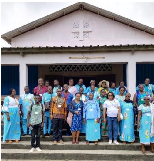
Membres de la Fraternité Charles de Foucauld d'Afrique, Bénin 2023.

Merci à toutes les fraternités de base de tout le continent. La rencontre continentale du Bénin en août 2023 nous a permis de nous connaître un peu plus. Merci pour tous les partages dans nos différents forums sur WhatsApp (nous en avons au moins 6). Vous avez fait preuve du désir de fraterniser, de vivre l'amitié entre les pays du continent. Et votre témoignage nous a fait grandir ensemble.