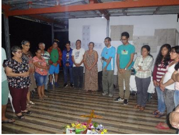
Rencontre de jeunes du continent. Costa Rica, 2019.

poursuivre le chemin. Nous nous sommes imprégnés de la richesse de nous connaître personnellement, d'écouter les témoignages de la vie fraternelle et de la réalité de chaque pays, de célébrer la vie et d'accompagner les souffrances de notre peuple, reconnaissants à Dieu pour tout l'amour qu'il a eu pour nous et pour tout ce que nous avons vécu à chaque instant.